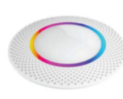
ゲートウェイ アンカーの検知 情報をアプリへ転送